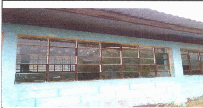
Foto1: SUSTITUCION DE VIDRIOS Y BALCONES